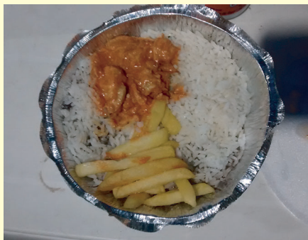
Comida: pouca e quase sem carne

DENUNCIE IRREGULARIDADES NA SUA OBRA. DISQUE SINDICATO: 2223-2908