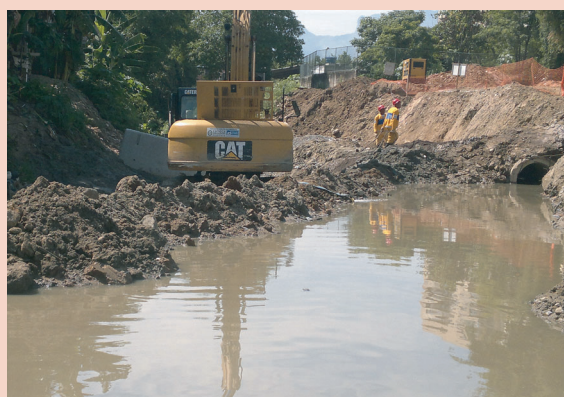
Trabalho no valão é insalubre!

A Construlagos se reuniu com a diretoria do Sitraicp e fechou a PLR no valor de um salário base. Aguardem detalhes para breve, companheiros!