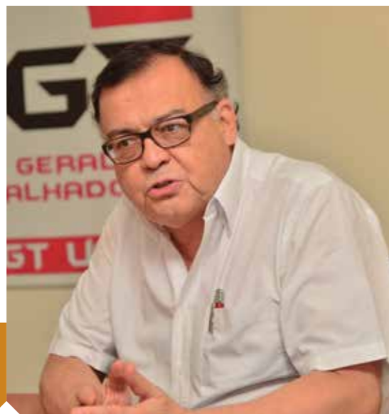
Victor Báez, secretário Geral da Confederação Sindical das Américas (CSA)

Nesse contexto, para o secretário Geral da CSA, a UGT cumpre um papel importante, uma vez que a Central é a segunda maior entidade brasileira e está entre as cinco maiores da América Latina, portanto, pode mirar sua luta não só nas questões brasileiras, mas também na situação mundial.