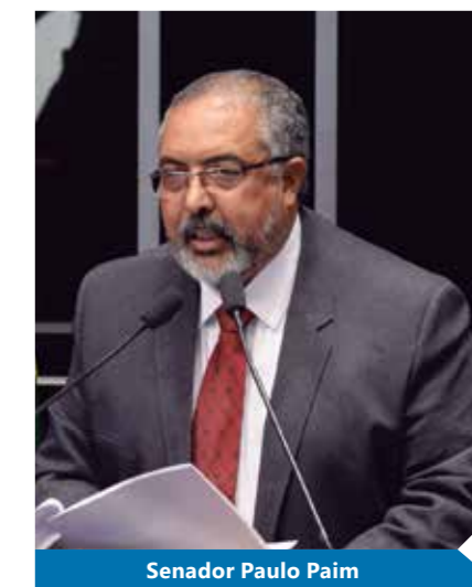
Senador Paulo Paim

"Mas o rolo compressor contra os nossos direitos não para por aí. Ainda tem a lei com a qual pretendem regulamentar o trabalho escravo. Trabalho escravo, a gente tem que proibir. Teve essa última decisão do Gilmar Mendes (juiz do Supremo Tribunal Federal), que diz que a Convenção Coletiva aprovada no ano anterior, que teria validade enquanto fosse aprovada a outra, já não vale mais, tirando, assim, a força da Convenção. Por tudo isso, tenho dito que é fundamental estarmos unidos – todas as centrais, todas as confederações, para fazermos um grande movimento nacional contra a retirada dos direitos dos trabalhadores, dos aposentados e pensionistas, enfim, lutar para que não diminuam o nosso direito", finalizou Paulo Paim.