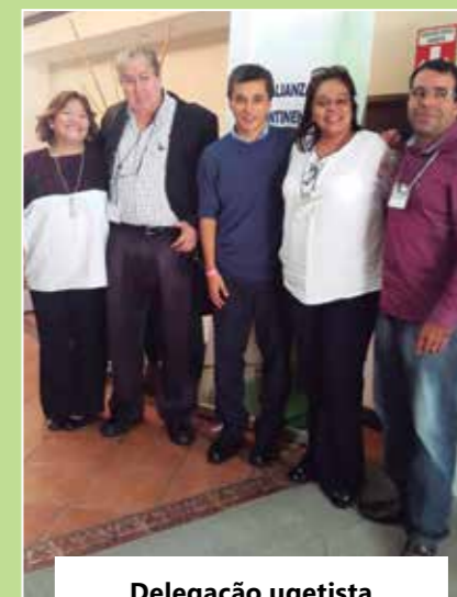
Delegação ugetista na OIT reforça a necessidade de implantar políticas de desenvolvimento nas terras indígenas

Outro problema relatado foi a PEC 215, que versa sobre o poder de homologação das terras indígenas pelo presidente da República e Congresso Nacional, além de querer rever as terras já demarcadas e homologadas. Do encontro, surgiu uma carta de repúdio a essa PEC, assinada por todos os participantes do evento, realizado entre os dias 26 e 30 de setembro.