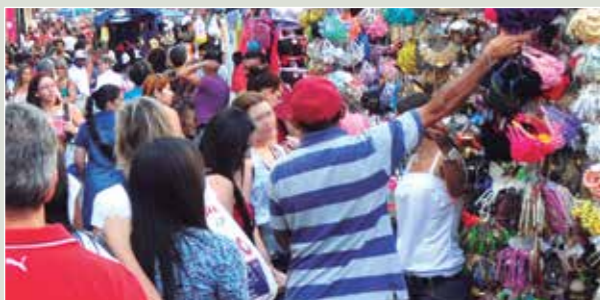
UM JEITINHO PARA DRIBLAR A CRISE. Pág. 36