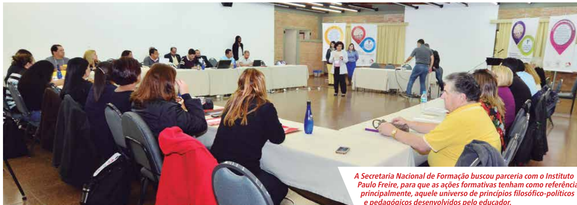
A Secretaria Nacional de Formação buscou parceria com o Instituto Paulo Freire, para que as ações formativas tenham como referência, principalmente, aquele universo de princípios filosófico-políticos e pedagógicos desenvolvidos pelo educador.

Para tanto, a Secretaria Nacional de Formação buscou parceria com o Instituto Paulo Freire, para que as ações formativas tenham como referência, principalmente, aquele