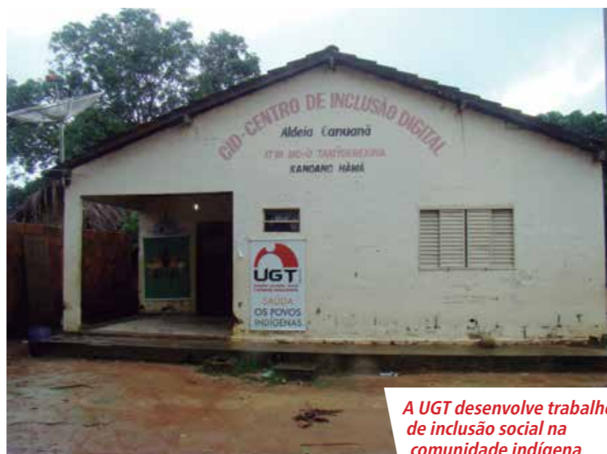
A UGT desenvolve trabalho de inclusão social na comunidade indígena

Os índios ainda enfrentam problemas com o lixo trazido das cidades, ausência de equipamentos públicos de saúde e educação, pesca predatória, mistura da língua indíge-