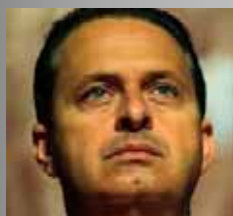
In Memoriam Eduardo Campos 1965 - 2014