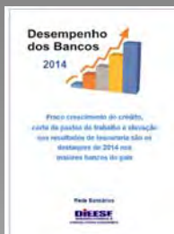
Desempenho dos bancos em 2014

Fracasso crescimento do crédito, corte de postos de trabalho e elevação dos ganhos de tesouraria são os destaques do ano passado nos maiores bancos do país. Os lucros são elevados em qualquer cenário econômico como mostra o Boletim produzido pela Rede Bancários que analisa os resultados de 2014.