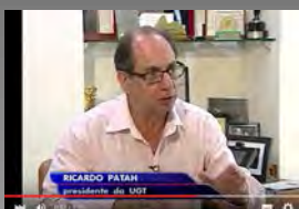
Assista ao vídeo > SBT Brasil (04/01/16) Walmart fecha lojas

Patah disse ainda que foram fechadas 17 lojas no Paraná; 14 no Rio Grande do Sul; 6 em São Paulo; 5 em Santa Catarina; 4 no Maranhão; 3 no Mato Grosso do Sul; 3 na Bahia; 2 em Minas Gerais; 2 em Alagoas; 2 na Paraíba; 1 em Goiás e 1 no Ceará.