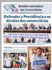
Confira o Informativo dos Comerciantes

A publicação " A OIT no Brasil " descreve as principais conquistas da OIT e detalha as atividades atuais da OIT para promover o trabalho decente no país. Ela oferece uma breve história da relação da OIT com o Brasil, uma visão geral da situação atual do país e os principais desafios remanescentes em questões relacionadas ao mundo do trabalho