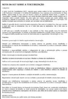
Nota da UGT sobre a Terceirização

O Projeto de Lei Consolidado, referente o Financiamento da Atividade Sindical, foi votado em 06.07.2016, na Comissão Especial destinada a Estudar e Apresentar Propostas com relação ao Financiamento da Atividade Sindical. O relatório será numerado na forma de Projeto de Lei e seguirá para mesa diretora determinar o despacho para prosseguir a tramitação.