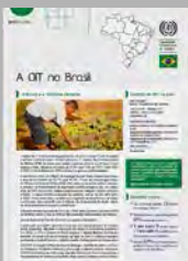
A OIT no Brasil

O UGT Global é o Boletim de Informação Internacional da União Geral dos Trabalhadores.