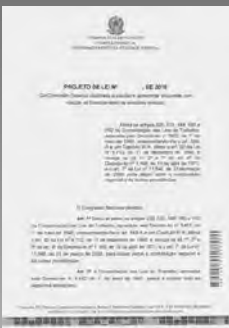
Projeto de Lei Consolidado