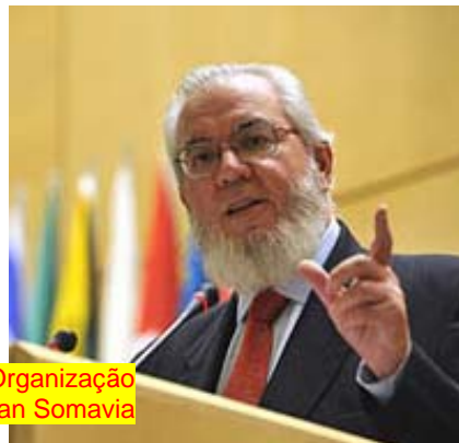
O Diretor-Geral da Organização Internacional do Trabalho, Juan Somavia

Falando na abertura do 99ª da Conferência Internacional do Trabalho , Juan Somavia advertiu que a recente crise da dívida e as medidas de redução do déficit, sobretudo nos gastos sociais, poderiam "afetar diretamente empregos e salários" em um momento de recuperação econômica fraca e manutenção de níveis elevados de desemprego.