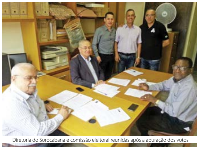
Diretoria do Sorocabana e comissão eleitoral reunidas após a apuração dos votos